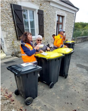
Distribution des bacs à Sauzelles

La distribution des bacs sur les 45 communes du territoire a débuté au mois de juin. Les équipes dédiées à cette tâche fastidieuse, bien épaulées par les élus et les agents communaux, devraient avoir terminé cette mission au cours du premier trimestre 2024.